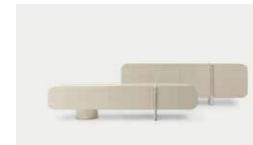
Petra 14, 24, 27