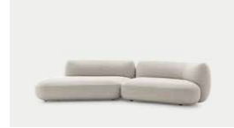
Nube 14, 16