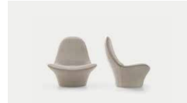
Manta 10, 16, 21