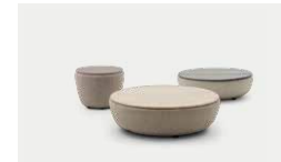
Deck 10, 12