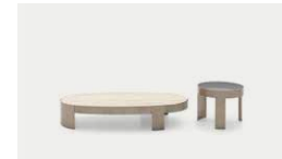
Mekki 14, 16, 23