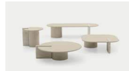
Petra 18, 22