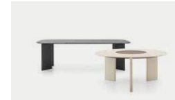
Cosmos 24, 28